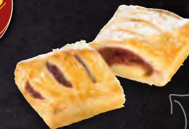
ART-NR: 13021 KIRSCH VANILLE STRUDEL 50 X 130 G