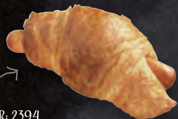
ART-NR: 2394 BUTTER-CROISSANT MIT WÜRSTCHEN FRANKFURTER ART 60 X 110 G