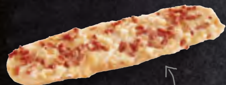
ART-NR: 124 FLAMMKUCHENBAGUETTE 18 X 140 G