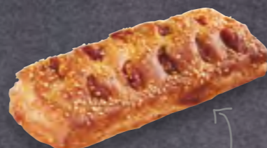
ART-NR: 10775 CURRYWURST SNACK 56 X 120 G