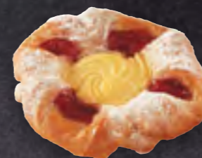
ART-NR: 10335 HIMBEER VANILLE PLUNDER 80 X 120 G