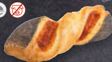
ART-NR: 2606 GEFLÜGELROLLE 50 X 145 G