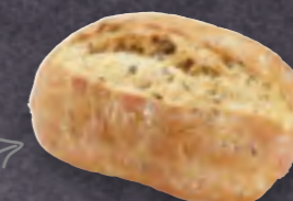
ART-NR: 452377 DINKELCRUSTY 100 X 80 G